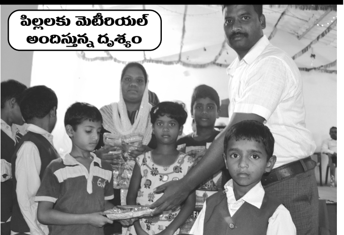
పిల్లలకు మెటిరియల్ అందిస్తున్న దృశ్యం