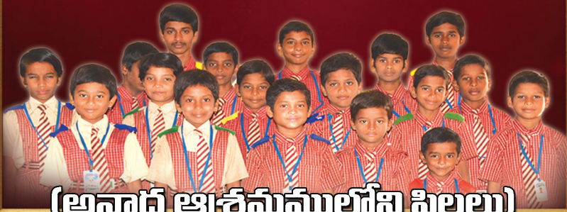
(అనాధ ఆశ్రమములోని పిల్లలు)

J.C.HOME లో ఉన్న విద్యార్థులలో మీకు నచ్చిన విద్యార్థిని సెలెక్ట్ చేసుకోవచ్చు. ఆ బాబు/పాప కు మిమ్మును పేరెంట్ గా పరిచయం చేస్తాము. ఆపై వారికి పేరెంట్ గా కొనసాగవచ్చు.