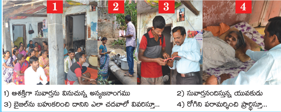
1) ఆశక్తిగా సువార్తను వినుచున్న అన్యజనాంగము 2) సువార్తనందిస్తున్న యువకుడు 3) బైబిల్ ను బహుకరించి దానిని ఎలా చదవాలో వివరిస్తూ... 4) రోగిని పరామర్శించి ప్రార్థిస్తూ...