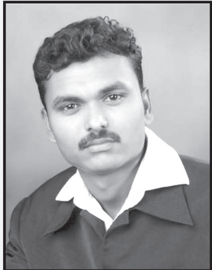
యేసునొద్దకు - మార్చుకో నీ జీవితాన్ని - జీవించు యేసుకొరకు - ఫలించు పరిపూర్ణముగా.

కాదు ఇంకెవరో ఉన్నారని చెప్పగానే, వెంటనే నేను వెళ్ళాను. అప్పుడు దేవుని బలమైన అభిషేకముతో నింపి, ఆ రోజు దేవుడు మాట్లాడిన మాటలు నా జీవితాన్ని ప్రభావితం చేసి నన్ను మార్చిగా మార్చివేసాయి. అప్పుడు నాకు గత నెల అక్కతో నేను చేసిన సవాల గుర్తుకొచ్చింది. సరిగ్గా ఆ మాట ప్రకారమే దేవుడు నా పట్ల తన చిత్తాన్ని తెలియజేసాడు. ఆ రోజు మొదలుకొని ఈ రోజు వరకు 29 మహాసభలలో దేవుని కొరకు బలమైన పాత్రగా అనేకులకు ఆశీర్వాదకరముగా వాడబడుటకు ప్రభువు కృప చూపించాడు. నేనెందుకు ఈ విషయం చెప్పుచున్నానంటే నా దేవుడు గొప్ప దేవుడు. అంతే గాక, నాతో కొంతమంది యోవ్వనస్థులను కలిపి ఒక టీమ్ గా ఏర్పడి ప్రార్థించడం దేవుని కొరకు పని చెయ్యడం మొదలుపెట్టి దానికి 'యూత్ రివైవల్ ఫైర్ మినిస్ట్రీస్' అనే పేరును ప్రతిష్ఠించాము. ఇప్పుడు మేమంతా కలిసి అనేక ప్రాంతాల్లో బహు బలముగా సేవా పరిచర్యలో కొనసాగుచున్నాను. మాలాగే మీరు విసికి వేసారి పోయిన జీవితాలు కలిగియుంటే మమ్మును మార్చిన యేసయ్య మిమ్మును కూడా మార్చి మాకంటే బలముగా ఆయనకొరకు బలమైన సాధనాలుగా వాడుకోవడానికి ఆయన పిలుస్తున్నాడు. రా నేడే