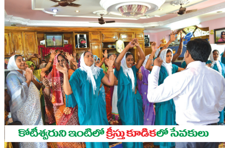
కోటిశ్వరుని ఇంటిలో క్రీస్తు కాడికలో సేవకులు

శక్తిచేతనైనను, బలముచేతనైనను కాక నా(దేవుని) అత్యచేతనే ఇది(ఇవి) జరుగునని(జరుగుచున్నవి)... - జెకయా 4:7.