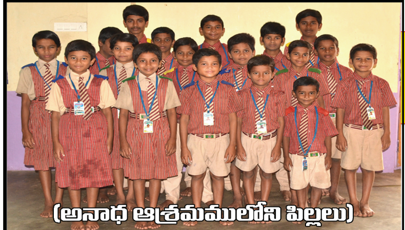
(అనాధ ఆశ్రమములోని పిల్లలు)

మా ప్రియమైన జె.సి హోమ్ స్టాఫ్ లోకు, అభిమానులకు ప్రభువు పేరట వందనములతో తెలియజేయునది.