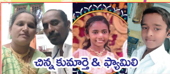
చిన్న కుమార్తె & ఫ్యామిలీ