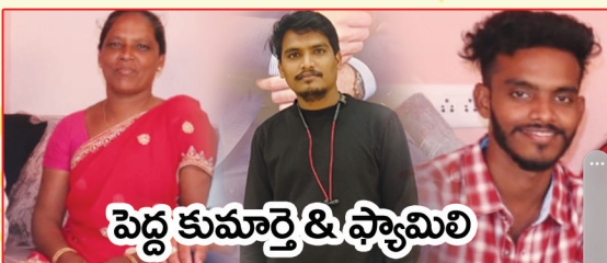
పెద్ద కుమార్తె & ఫ్యామిలీ