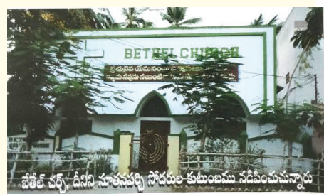
బేతేల్ చర్చి, దీనిని సూర్యుని సోదరుల కుటుంబము నడిపించుచున్నారు

తెల్లవారుజామున లేచి ప్రార్థనలో గడిపి, వంటచేసి, పిల్లలను స్కూలుకు వంపి, మోకాళ్ళూని కొన్ని గంటలు ప్రార్థనలో గడిపేది. ఆమె కన్నీటి ప్రార్థనలే ఆ కుటుంబానికి వెలుగు చూపింది. ప్రార్థన ముగిసిన తరువాత ఆమె ముందున్న నేల కన్నీటితో తడిసి ఉండేది. కన్నీటి ప్రార్థన వారి సేవను ఫలించజేసింది. నశించు ఆత్మల కొరకు, రోగుల కొరకు, దురాత్మల చేత పీడింపబడుచున్న వారి కొరకు కన్నీళ్ళతో ప్రార్థించి అనేకులకు రక్షణ, స్వస్థత, విడుదలకు కారకురాలయింది. ఆమె ఎడతెగక చేసిన కన్నీటి ప్రార్థన వారి కుటుంబాలను ఆశీర్వాదములకు వారసులను చేసింది. కుటుంబస్తులందరూ రక్షణ పొంది, పరిశుద్ధాత్మతో నింపబడి పెంతెకోస్తు